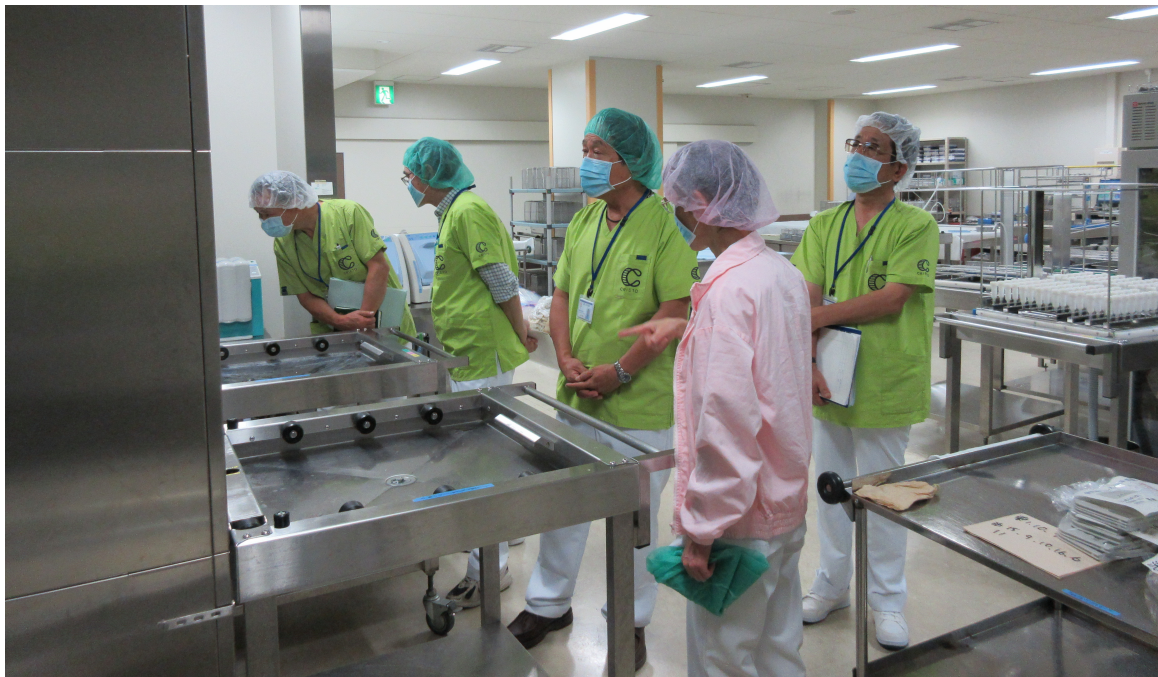
図 1. ASU プログラムでの現場実習の様子

企業研究員や研究者が医療現場に入り、医療現場で本当に必要とされ、デザイン思考なども用いて、“事業化に資するニーズ”を医療従事者とともに探索するとともに、スピード感をもった事業化の推進へとつなげるプログラム。海外における現場観察のための事例も参考にし、2010年より医療現場に入るためのルールと仕組みを統合的に整備し、2014年3月プログラムを開始しました。日本全国から多数の企業研究員が“こんなものがほしかった！”と患者さんや医療従事者に言ってもらえるような製品、システムの開発につなげるべく、取り組んでいます。