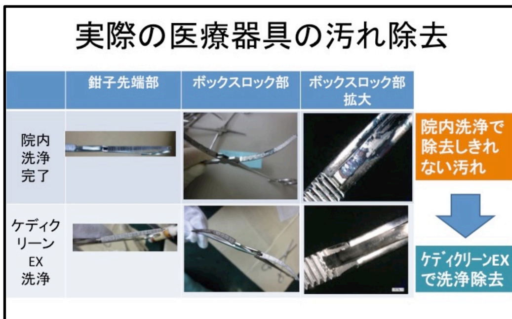
図 3.実際の医療器具の汚れ

従来の洗浄液と比較して、WD(自動シャワー洗浄機)は使用せず、超音波洗浄機を使用して、予備洗浄、ブラッシングなどの工程を削減できる